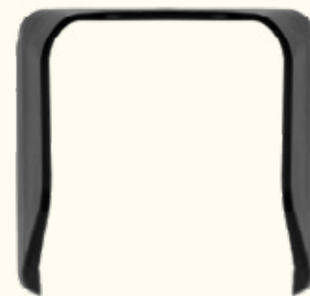
V400c plus Sichtschutz